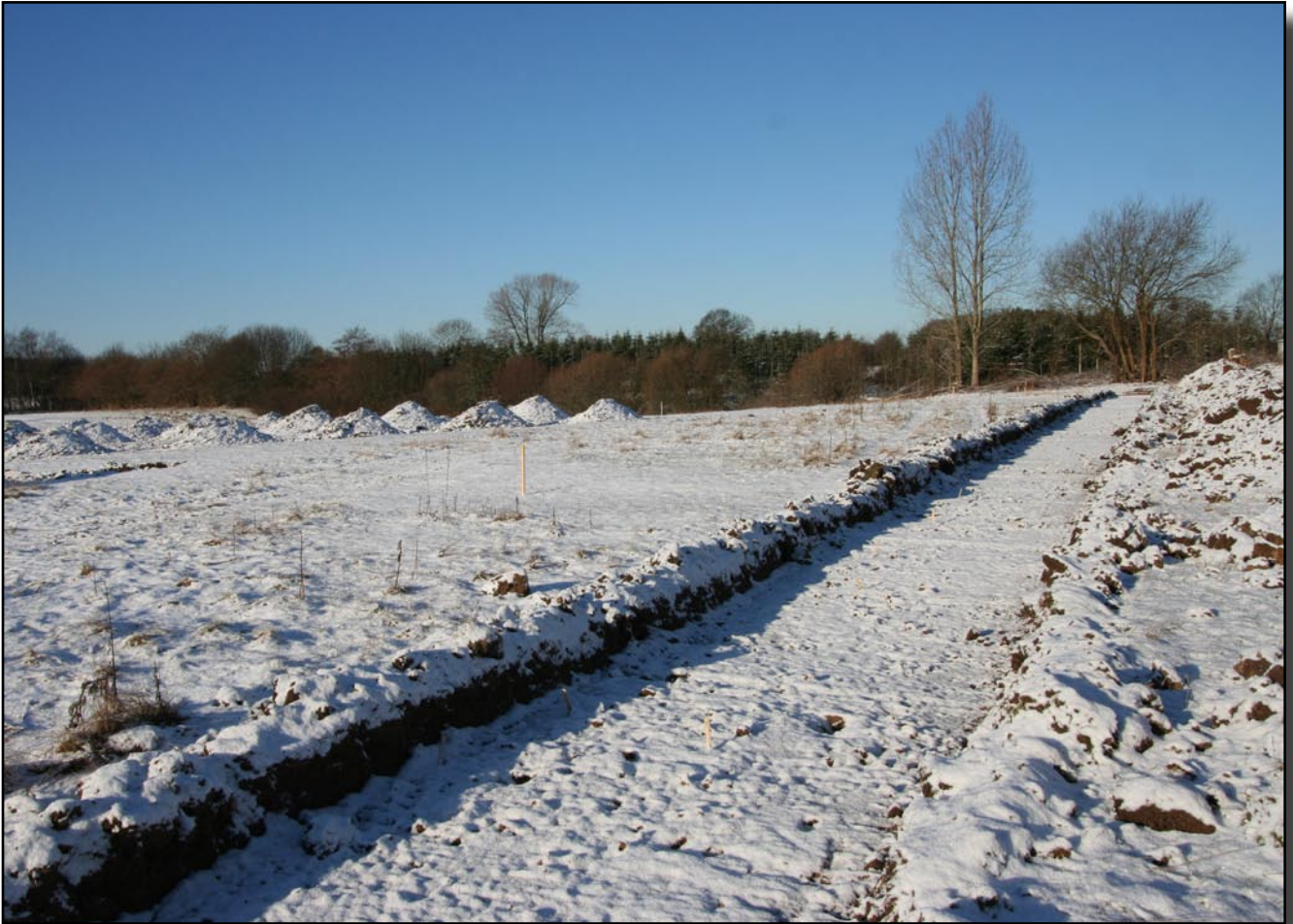
Søgegrøfterne ved Skovsbovej N I efter snevej

Forfatter: Anne Garhøj Rosenberg, museumsinspektør