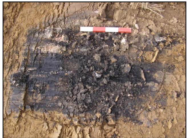
Fig. 3: Eksempel på kogestensgrube fra den nærliggende Tankefuld-udgravning

Kogestensgrubernes udbredelse på pladserne er meget varieret: Nogle steder ligger de på rækker, og andre steder ligger de i koncentrationer. De kan også både ligge indeni huse og udenfor huse. På mange pladser ligger de tilsyneladende tilfældigt spredt.