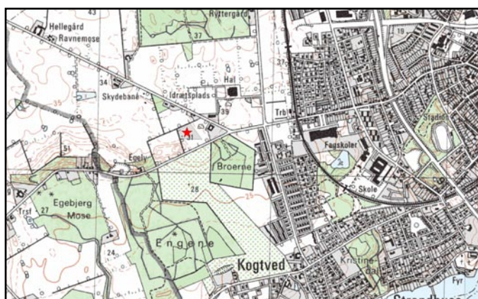
Fig. 1: Udgravningens (rød stjerne) placering i Svendborgs vestlige udkant

I forbindelse med en forundersøgelse af matr. 12a på Skovsbovej i Svendborgs vestlige udkant er der undersøgt et areal på ca. 1 hektar. Ved forundersøgelsen blev der fundet spredte spor efter en forhistorisk bosættelse, formodentlig fra yngre bronzealder eller ældre jernalder (dvs. ca. 1000 f.Kr. til 200 e.Kr.).